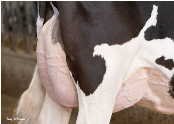
PROGENESIS GAMEDAY SIGNAL GRANDDAM