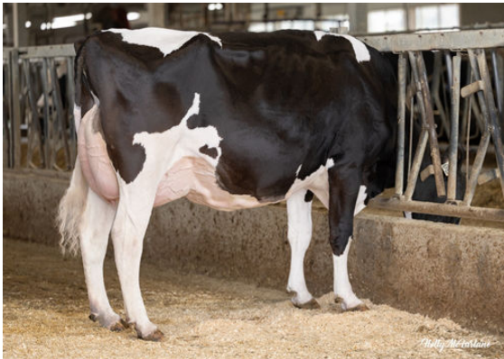
PROGENESIS GAMEDAY SIGNAL GRANDDAM